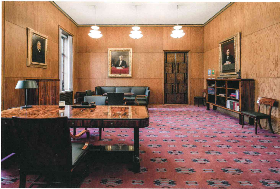
Pingotettu villamatto luo tyyliä ja arvokkuutta eduskunnan puhemiehen siivessä olevaan huoneeseen.

ja työ arvokasta, kannattaa tekstiililattioita hoitaa hyvin. Hyvin hoidettuina ne kestävät kulutusta ja näyttävät hyvältä pitkään.